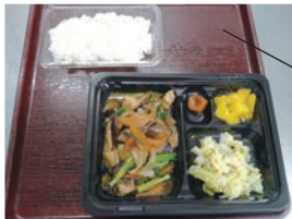
使い捨て容器で食事を提供

常食、治療食、嚥下食等全ての食種に対応した。保健所より「汁物の提供は中止する医療機関も多い」とのことだったが、当院ではスタッフの協力により汁物も通常通り提供、常食の方には看護師を通じて「選択メニュー」の希望も伺い提供することができた。