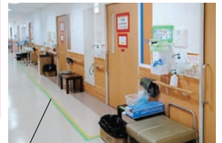
換気のため床のテープのみでゾーニングを行った