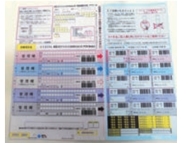
厚生労働省により定められた梱包手順