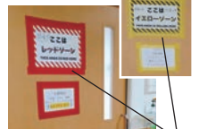
レッドゾーン、イエローゾーンをわかりやすく表示(保健所より配布)