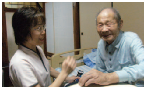
(写真掲載の承諾をいただいています)

病院耐震化のための増改築工事（全4期）は、第4期の新北棟（在宅支援棟）の増築工事を行っています。地盤改良工事が完了し、10月の鉄骨組み立てに向けて、掘削・鉄筋・型枠・コンクリート打設等の基礎工事を行っています。引き続き工事関係車両の出入り、騒音・振動等、皆さまにご迷惑をおかけいたします。ご理解とご協力に深く感謝いたします。