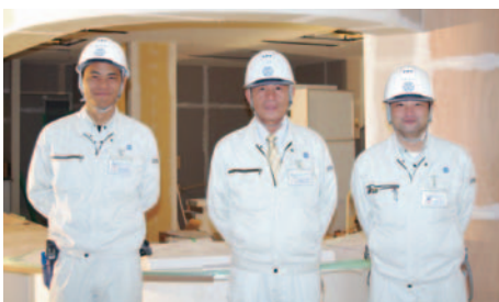
建築現場責任者の皆さま

す。ホームページの「工事現場レポート」で詳細をご覧いただけます。皆さまのあたりに深く感謝いたします。