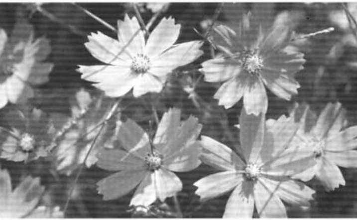
コスモスは、秋に桃色・白・赤などの花を咲かせますが、品種改良により黄色・オレンジなどの色も作り出されています。かわらや休耕田、スキー場に植えられたコスモスの花畑は見事です。