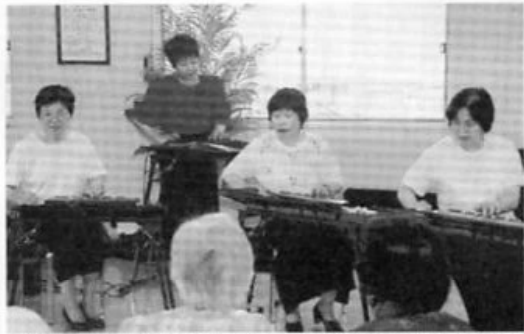
大正琴の調べは懐かしくもあり新鮮でもあり、とても楽しい会でした。

6月9日、療養病棟では「すずらん会」カトレアグループ8名の皆様によるボランティア大正琴演奏会が開催されました。 「心ゆたか」「星影のワルツ」「瀬戸の花嫁」「黒田節」など、カトレアグループの方が奏でる大正琴の澄んだ音色と美しい調べに、手拍子をしたり口ずさんだり、楽しいひとときを過ごすことができました。ご入院中の皆様の笑顔と、暑さを忘れさせてくれる大正琴の音色に、安らぎを覚えた素敵な演奏会でした。 すずらん会の皆様、そしてご協力くださった方々に心より感謝申し上げます。ありがとうございました。